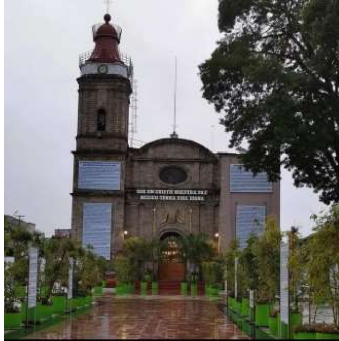
Parroquia de San Martín Obispo de Tours, Ocoyoacac

religioso en San Marín Obispo), y ordeno que se le diese al pueblo recién formado el nombre de San Martín Ocoyacac. Con el tiempo, el nombre del pueblo Ocoyacac, por corrupción se convirtió en San Martín Ocoyoacac. ( Ibidem p. 14)